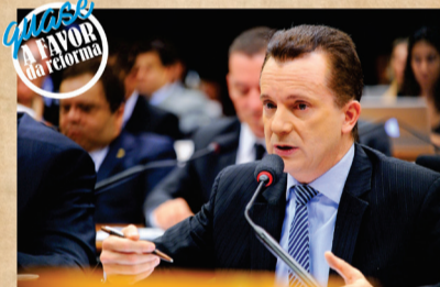
Celso Russomanno PRB

E-mail: dep.celsorussomanno@camara.leg.br