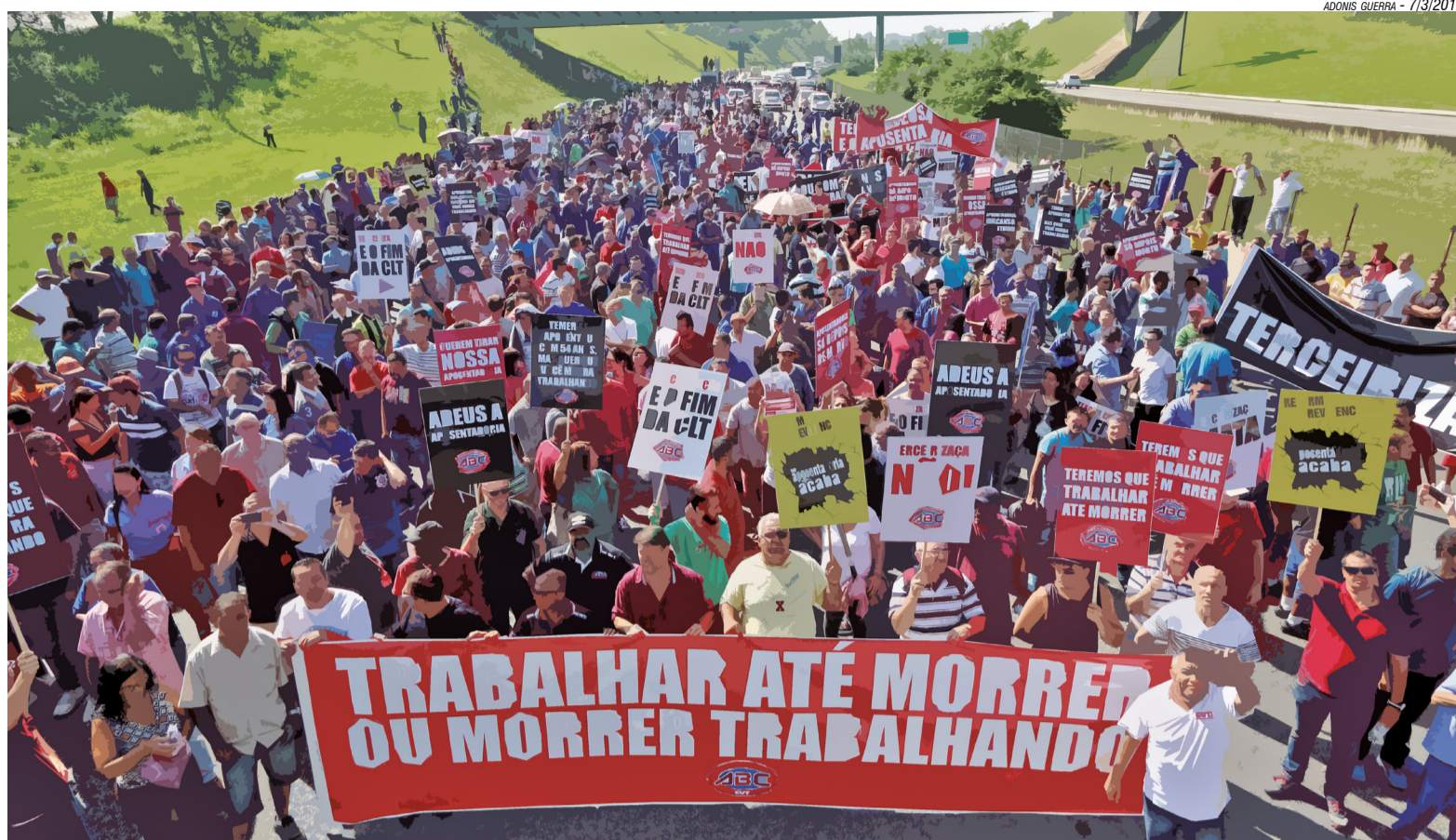
ADONIS GUERRA - 7/3/2017