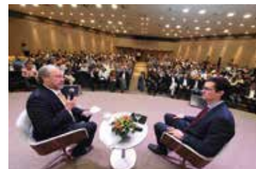
No parque aquático

Dallagnol pediu à Moro dinheiro da Vara Federal de Curitiba para a produção de um vídeo sobre medidas contra a corrupção que seria veiculado pela Globo.