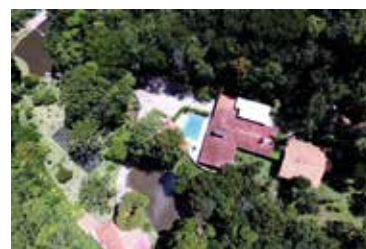
Sítio de Atibaia 1

Dallagnol pediu 4 passagens e hospedagens para a família no Beach Park como condição para dar palestra sobre combate à corrupção na Fiec e cobrou cachê.