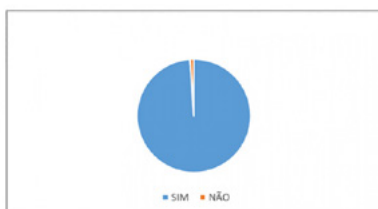
Gráfico do resultado da assembleia online realizada no dia 09/04/2020 com os trabalhadores na Kostal, em São Bernardo

Para garantir o isolamento social dos trabalhadores diante da pandemia do Covid-19, o Sindicato tem realizado assembleias com votação virtual no novo site dos Metalúrgicos do ABC. Já foram realizadas consultas aos trabalhadores em sete empresas, que apreciaram e aprovaram as negociações feitas para garantir o isolamento social, emprego e renda.