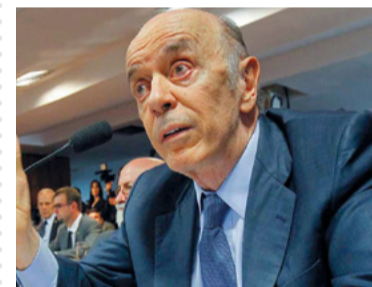
Busca e apreensão

A câmara aprovou auxílio em parcela única de R$ 3 mil para agricultores que não receberam auxílio emergencial. Agricultoras chefes de família receberão R$ 6 mil.