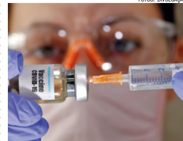
Vacinas em testas

Vacinas da Universidade de Oxford e da Alemanha anunciaram respostas imunes "fortes" contra covid-19. Testes envolveram 1.077 pessoas.