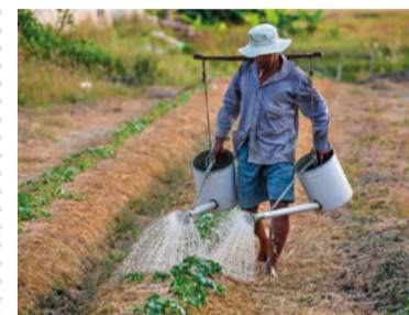
Auxílio para agricultores

Vacinas da Universidade de Oxford e da Alemanha anunciaram respostas imunes "fortes" contra covid-19. Testes envolveram 1.077 pessoas.