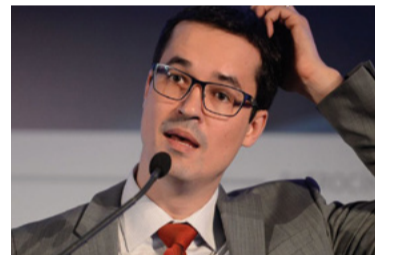
Saídas da Lava Jato

Lewandowski (STF) determinou que a vara da Lava Jato em Curitiba entregue a Lula cópia do conteúdo do acordo de leniência da Odebrecht que faça referência a ele.