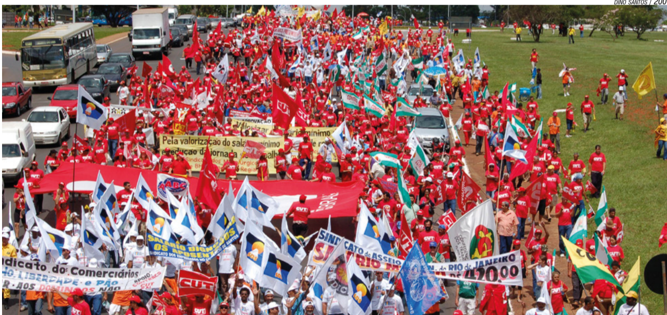
DINO SANTOS / 2006

A política de valorização do Salário Mínimo foi criada no governo Lula e continuada com Dilma. Foi resultado da ação conjunta das centrais sindicais, por meio das “Marchas a Brasília”, com objetivo de reforçar a importância social e econômica da proposta de valorização do salário mínimo.