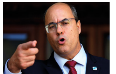
Suspeito e afastado

Oito procuradores da Lava Jato em SP pediram demissão por divergências com uma procuradora. Em Curitiba, investigado, Dallagnol também se afastou.