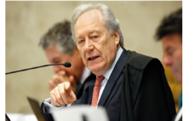
Vitória de Lula

A CUT pediu revogação de portaria de Bolsonaro que tirou a Covid da lista de doenças ocupacionais, o que garantiria ao trabalhador uma série de proteções.