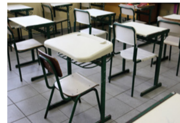
Contra a volta às aulas

Donald Trump afirmou em entrevista ao jornalista Bob Woodward que escondeu de propósito a gravidade do coronavírus. “Não quero criar pânico”.