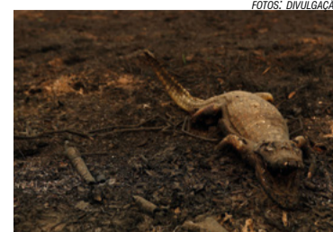
Queimadas no Pantanal

Pelo ritmo, setembro de 2020 será o mês com maior número de queimadas já registrado na história no Pantanal. Já são 5.603, quase 3 vezes acima da média.