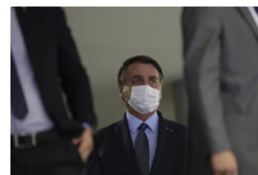
Mas “tá de parabéns”!

Oito países europeus enviaram carta ao vice-presidente, Mourão, em que dizem que o aumento do desmatamento dificulta a compra de produtos brasileiros.