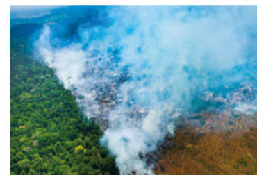
Desmatamento e a exportação

Pelo ritmo, setembro de 2020 será o mês com maior número de queimadas já registrado na história no Pantanal. Já são 5.603, quase 3 vezes acima da média.