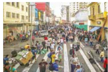
Flexibilização em SP

A Covid-19 provocou mais mortes e teve maior incidência de casos em municípios mais favoráveis à Bolsonaro, segundo pesquisa da UFRJ.