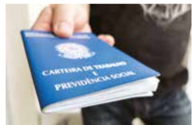
MP 936 prorrogada

O governo Covas admitiu que a flexibilização da quarentena, com entrada na fase-3 amarela aumentou contágio por Covid-19 na periferia.