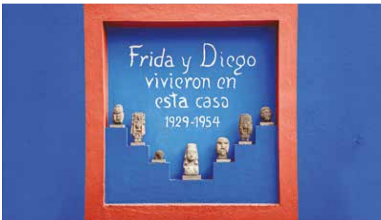
Passeio virtual MUSEU FRIDA KAHLO