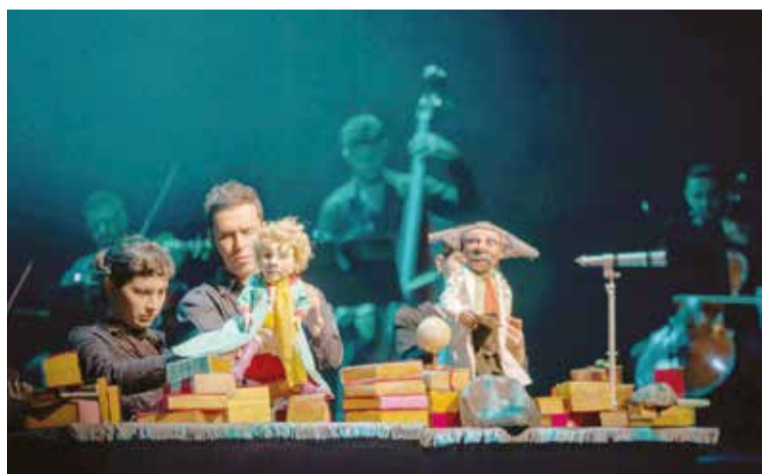
Infantil O PEQUENO PRÍNCIPE

A Mostra reúne filmes contemporâneos de oito países do continente. Cada filme fica disponível por uma semana. Até o próximo dia 21 está no ar “Rosas Venenosas” (2018 - Egito) que conta a história de uma jovem que vive em um pequeno bairro no Cairo, rodeada de costumes religiosos e conservadores. Assista em: mostradecinemasfricanos.com