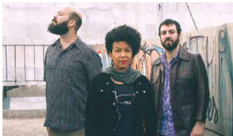
Show hoje METÁ METÁ

Conheça a casa onde viveu uma das maiores artistas plásticas do México. O Museu Frida Kahlo, também conhecido como La Casa Azul, disponibilizou um tour virtual e gratuito por seus jardins, galerias e obras. No site oficial do Museu Frida Kahlo, é possível “caminhar” pela casa e conhecer o universo da artista.