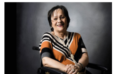
Violência contra mulher

A OMS prometeu ao Brasil até 14 milhões de doses a partir deste mês. Aliança criada pela Organização visa distribuir imunizante para todos os países.