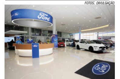
Saída da Ford

As redes de concessionárias cobram reembolso superior a R$ 1,5 bilhão antes que a montadora inicie sua nova fase, apenas com modelos importados.