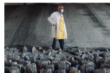
'Pedras da injustiça'

Quase 80% dos médicos reprovam atuação do Ministério da Saúde na pandemia. Associação Médica Brasileira ouviu 3.882 profissionais de todas as regiões.