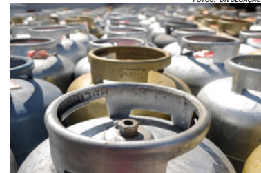
Gás de cozinha

Os preços abusivos praticados pela Petrobras vêm sendo criticados pelos revendedores, que não descartam paralisações e manifestações em todo o país.