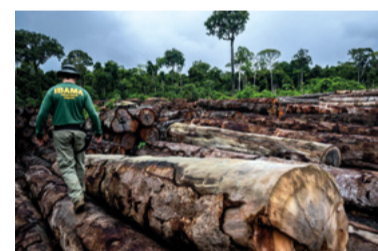
Passando a boiada

O padre Júlio Lancellotti foi até o viaduto na Av. Salim Farah Maluf para dar marretadas nas pedras 'anti-moradores de rua' instaladas pela Prefeitura SP.