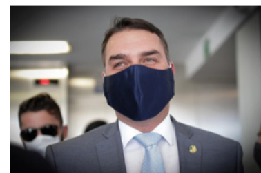
Começo do fim

A PEC para destravar o auxílio emergencial recebeu críticas no Senado e a votação deve ser adiada para a próxima semana. Lideranças cobram novo parecer.