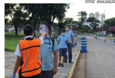
Luta na Ford 1

A produção na Ford em Taubaté foi retomada esta semana após acordo firmado no TRT. Os trabalhadores estão protegidos por uma blindagem jurídica tripla.