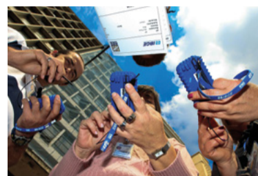
Corte no censo

A vereadora do Psol, Erika Hilton, é a primeira mulher trans a presidir uma Comissão Legislativa do parlamento paulistano. Suplicy (PT) será o vice.