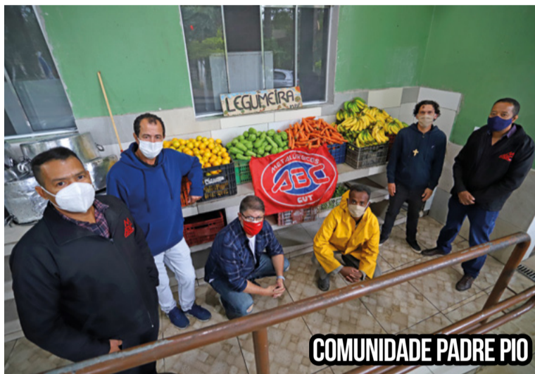
COMUNIDADE PADRE PIO

“É muito importante nos espelharmos em quem dedica a vida aos que mais precisam”