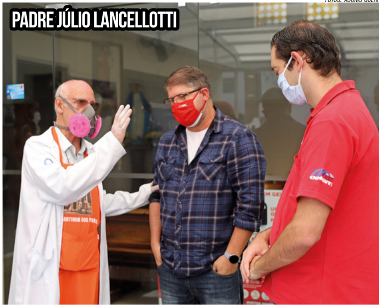
PADRE JÚLIO LANCELOTTI