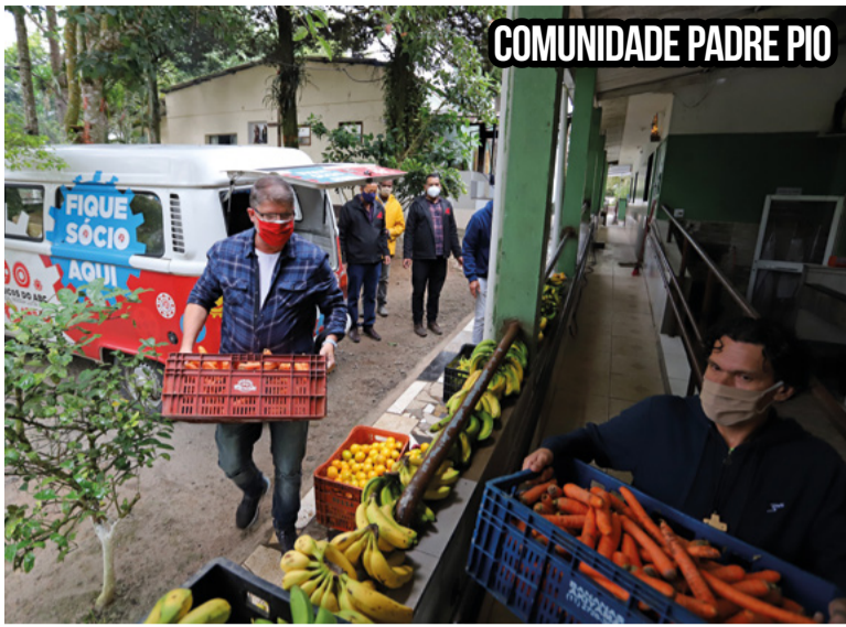
COMUNIDADE PADRE PIO