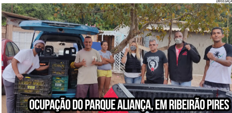
OCUPAÇÃO DO PARQUE ALIANÇA, EM RIBEIRÃO PIRES