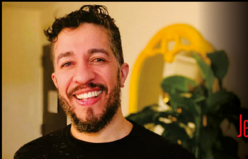
Jean Wyllys Ex-deputado