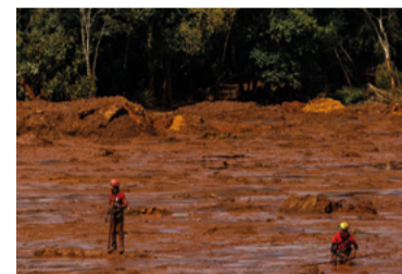
Crime em Brumadinho

Bolsonaro recorreu ao STF para não oferecer conexão à internet a alunos e professores de escolas públicas. Repasse é de R$ 3,5 bi a estados e municípios.