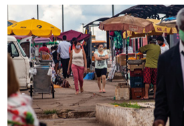
Por conta própria

A Vale se recusa a pagar indenização pelos trabalhadores mortos em Brumadinho. Valor de R$ 1 milhão por dano moral foi decidido pela Justiça.