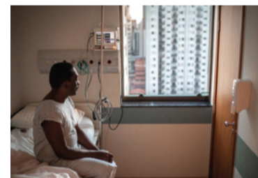
Planos de saúde

Metade dos trabalhadores por conta própria tinha renda inferior a R$ 1 mil antes da pandemia, aponta estudo do IBGE, 48% dos profissionais autônomos.