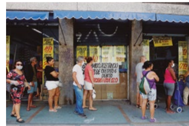
Diminuição da renda

Celebrado hoje, o Dia da Luta Operária vai homenagear personagens do passado recente do país e alguns que estão na linha de frente no combate à pandemia.