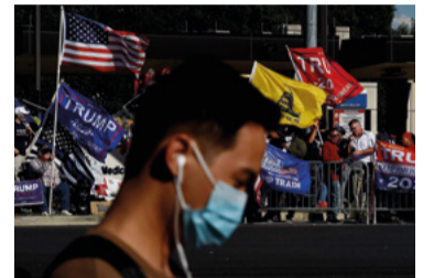
Pandemia nos EUA

O país que mais consome agrotóxicos é o mesmo que voltou ao mapa da fome. Entre 23 de julho e 19 de agosto foram liberados mais 99 agrotóxicos no Brasil.