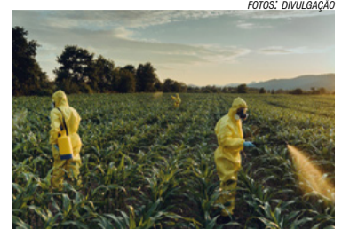
Muito veneno e pouca comida

O país que mais consome agrotóxicos é o mesmo que voltou ao mapa da fome. Entre 23 de julho e 19 de agosto foram liberados mais 99 agrotóxicos no Brasil.