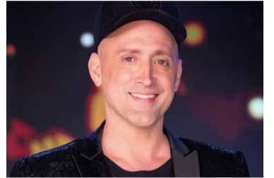
Lei Paulo Gustavo

Um artigo da revista Lancet registrou que as cidades que deram mais votos a Bolsonaro em 2018 tiveram o dobro do índice de mortalidade por Covid-19.