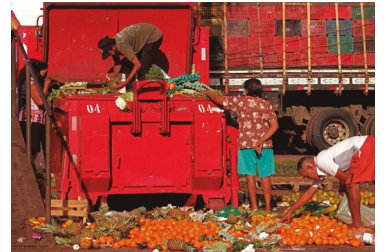
Avanço da fome

O Comando Nacional dos Bancários conseguiu compromisso das empresas de analisar a reivindicação de incluir na convenção coletiva artigo sobre assédio sexual.