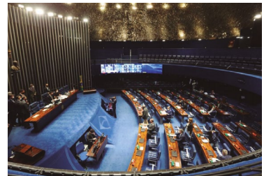
PEC do Desespero

Relatório da ONU aponta avanço global da fome. No Brasil, insegurança alimentar aumentou de 37,5 milhões de pessoas para 61,3 milhões.