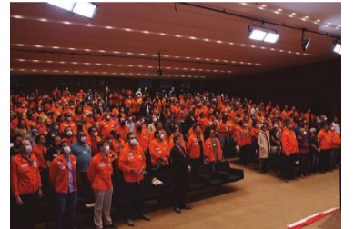
Contra o PL 1.583

O país teve mais de 8 mil mortes por Covid-19, após governo encerrar ‘Estado de Emergência’. “Brasil segue exterminando seu povo”, diz especialista da Fiocruz.