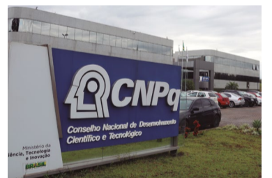
Desmante na tecnologia

A Inadimplência bateu recorde, atingindo 66,6 milhões de brasileiros em maio. É o maior contingente desde o começo da série histórica, em 2016, revela o Serasa.