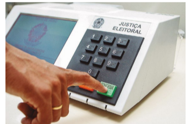
Imposto de renda

Várias medidas foram tomadas pela oposição e pelo grupo de advogados Prerrogativas sobre as mentiras disseminadas pelo governo contra o sistema eleitoral.