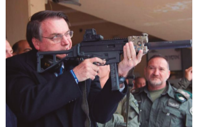
Teorias conspiratórias 2

O TSE desmentiu 20 declarações feitas por Bolsonaro questionando o sistema eleitoral brasileiro e as urnas eletrônicas em encontro com embaixadores transmitidas pela TV Brasil.