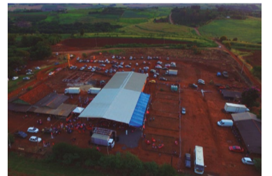
O agro desmata

A falta de correção da tabela do IR combinada com o aumento da inflação no Brasil tem gerado um aumento histórico da tributação sobre a população com menor poder aquisitivo.