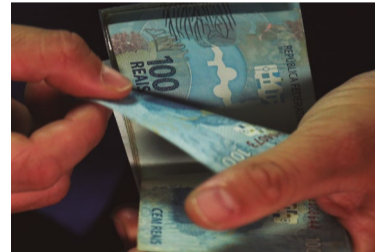
Salário mínimo ideal

Foi realizada ontem audiência pública no Senado para denunciar o assédio a trabalhadores no McDonalds com depoimentos daqueles que sofreram abusos.