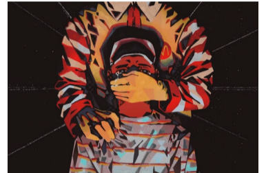
Assédio no McDonalds

Começou a campanha nacional para vacinar crianças e adolescentes contra pólio e outras doenças. O público-alvo no caso da poliomielite são crianças menores de 5 anos.