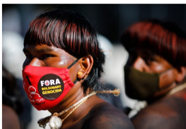
Contra o meio ambiente

Quase 1,6 mil militares receberam benefícios de mais de R$ 100 mil neste ano, inclusive o ex-ministro da Saúde, Eduardo Pazuello, um dos responsáveis por centenas de vidas perdidas na pandemia.