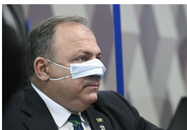
Farra dos militares

Pesquisa do Ipec (ex-Ibope) sobre o cenário eleitoral no estado de SP mostra o ex-prefeito Fernando Haddad (PT) na liderança, com 29% das intenções de voto.