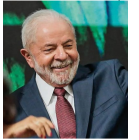
Lula na COP

O presidente eleito Lula pleiteou à ONU que a COP30, em 2025, seja realizada na Amazônia. “Acho importante que as pessoas que defendem a Amazônia conheçam a região e a sua realidade concreta”, afirmou, ontem, no Egito, onde ocorre a COP27, cúpula do meio ambiente realizada pela ONU.