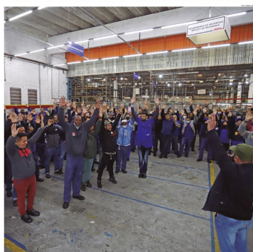
OS TRABALHADORES APROVARAM FAZER A LUTA QUE FOR NECESSÁRIA PARA CONQUISTAR REPOSIÇÃO DA INFLAÇÃO, AUMENTO REAL E CLAUSULAS SOCIAIS.