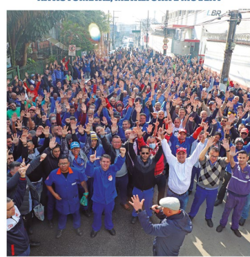
EM ASSEMBLEIA CONJUNTA DE CAMPANHA SALARIAL, TRABALHADORES MOSTRARAM QUE VÃO BUSCAR REAJUSTE SALARIAL, AUMENTO REAL E CLAUSULAS SOCIAIS.