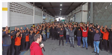
MOBILIZAÇÃO É PARA PRESSIONAR OS PATRÕES POR REAJUSTE E AUMENTO REAL SEM PARCELAMENTO