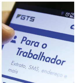
Saindo do vermelho

Prévia sobre inflação divulgada com dados de 2022 tem resultado um pouco acima de dezembro e abaixo de janeiro passado, com alimentos subindo menos, gasolina caindo, alta em planos de saúde e reajuste do gás encanado. O IPCA e o INPC deste mês serão divulgados em 9 de fevereiro.