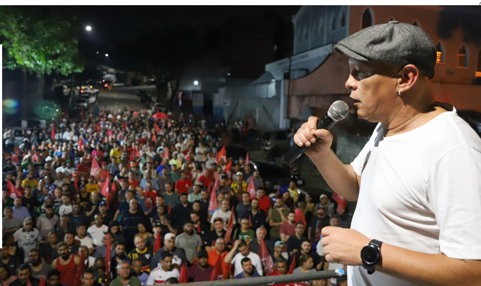
G3: protocolado ontem 13h37

SÃO PAULO, 06 DE OUTUBRO DE 2023. DA: FEDERAÇÃO DOS SINDICATOS DE METALÚRGICOS DA CUT NO ESTADO DE SÃO PAULO - FEM-CUT/SP - SEUS SINDICATOS REPRESENTADOS.