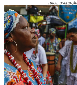
Casos de racismo

Com a maior população negra fora do continente africano, o Brasil registrou em 2023, um total de 176.055 processos judiciais envolvendo casos de racismo ou intolerância religiosa, segundo dados da startup JusRacial.