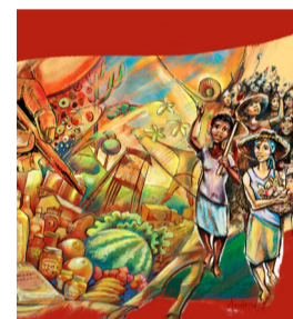
MTS 40 anos

Com a maior população negra fora do continente africano, o Brasil registrou em 2023, um total de 176.055 processos judiciais envolvendo casos de racismo ou intolerância religiosa, segundo dados da startup JusRacial.