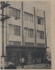
O Projeto para pagar um pouco tráfego pela desap- propriação da nossa sede não temo. Veja as providências que o Sindicato está tomando na pág. 4.

A diretoria do Sínica cumprir dizer que, com a construção da nova se- de, ter dado solução a todos os problemas rela- tivos à linha de benefici- os aos associados. Termin- ando a sede, daqui a um ano, poderemos pensar na construção de nossa colônia de férias.