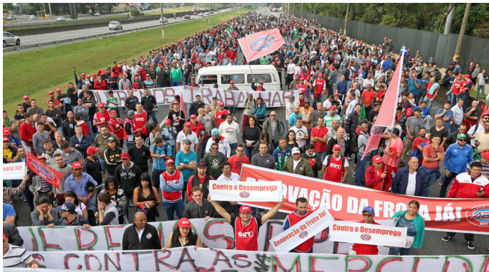
ATO EM DEFESA DO EMPREGO | 01/JUN/2016