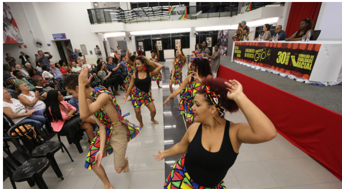
COMISSÃO DE IGUALDADE RACIAL DO SINDICATO | 27/NOV/2017