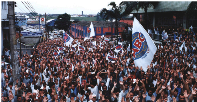
ANIVERSÁRIO DO SINDICATO DOS METALÚRGICOS D@ ABC | 12/MAI