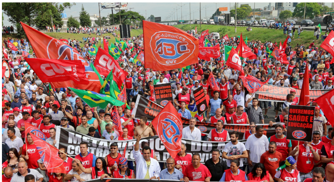
ATO CONTRA REFORMA DA PREVIDÊNCIA | 09/DEZ/2016