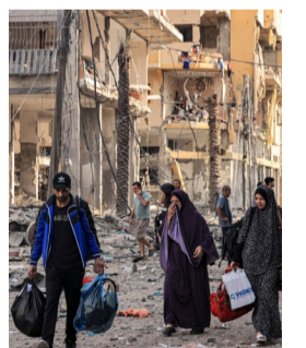
Ameaça de Israel

Todos integram o grupo que participou diretamente dos atos violentos. Os sentenciados receberam penas que variam de 3 a 17 anos de prisão, além do pagamento de multa de R$ 30 milhões por danos morais coletivos.