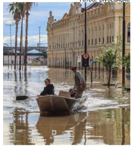
Ações no RS

O ministro extraordinário para Apoio à Reconstrução do RS, Paulo Pimenta, anunciou a chegada de 27 bombas de escoamento de água. Elas serão utilizadas para esvaziar as áreas alagadas na região metropolitana de Porto Alegre. A Sabesp enviou 18 bombas.