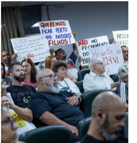
Privatização da Fundação Casa

O ministro Alexandre Padilha, das Relações Institucionais, afirmou que o governo é contrário à PEC 3/2022, que facilita a privatização das praias. “O governo é contrário a qualquer programa de privatização das praias públicas, que cerceiam o povo brasileiro de poder frequentar essas praias”.