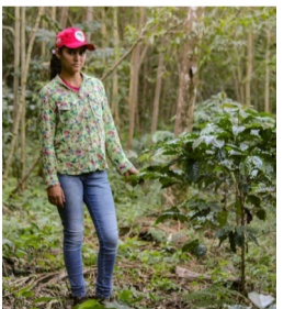
2ª Jornada da Natureza

A discussão sobre a privatização da Fundação Casa de São Paulo tem gerado preocupação nos últimos tempos. Em especial, pelos servidores que prestam atendimento socioeducativo e lidam com jovens envolvidos em infrações que vão desde delitos leves até crimes graves.