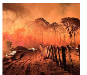
Pantanal em chamas

O país criou um milhão de empregos formais de janeiro a maio, um saldo de positivo de 1.088.955. O estoque, ou seja, o total de pessoas trabalhando no Brasil com carteira assinada, alcançou 46,6 milhões, um recorde na série histórica.