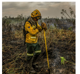
Incêndios no pantanal

Após sucessivos ajustes, com idas e vindas entre as duas casas do Congresso e nove meses de tramitação, a reforma do novo ensino médio segue agora para a sanção presidencial, após ter sua última versão aprovada na terça-feira, 9, na Câmara. O projeto aprovado prevê a aplicação de todas as mudanças já para 2025.