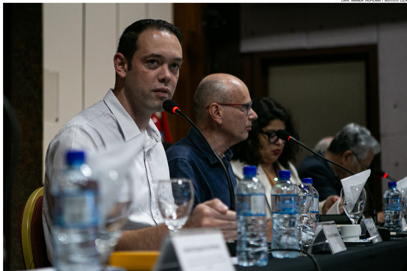
CAPA: AMANDA TROPICANA / INSTITUTO LULA

De olho nessas relações, o governo chinês de Xi Jinping lançou em