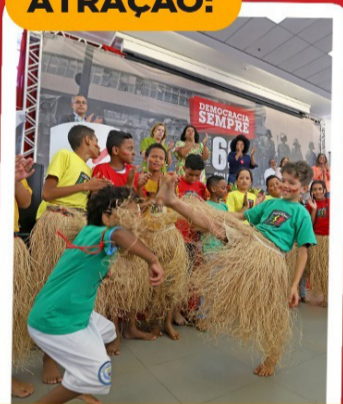
PROJETO SOLANO TRINDADE

COM PARTICIPAÇÃO DOS MESTRES ZUMBI, CANELINHA E MAIS CONVIDADOS