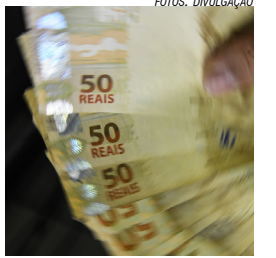
Inscrição do IR

O governo Lula pretende passar a cobrar mais impostos de quem ganha mais de R$ 1 milhão por ano para poder isentar do Imposto de Renda trabalhadores que recebem até R$ 5 mil por mês. A proposta foi revelada na última quarta-feira, 9, à Folha de S.Paulo.