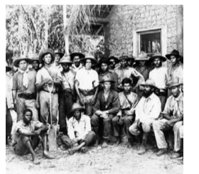
Coluna Prestes 100 anos

A administração Ricardo Nunes (MDB) coleciona mais uma suspeita em licitação e contratos. Dessa vez, a denúncia, exclusiva da TVT News, é que a empresa habilitada no pregão eletrônico ofereceu valor R$ 27 milhões acima da concorrência.