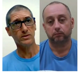
Julgamento caso Marielle