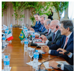
Super-ricos no G20

O Brasil reforçou que temas como igualdade de gênero e a taxação de bilionários devem ser mantidos na declaração final do encontro da Cúpula do G20, realizado no Rio de Janeiro. Isso apesar de resistências expressas da delegação argentina.