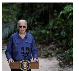
Conservação da Amazônia

Outro ponto de tensão foi a inclusão de um compromisso para avançar na tributação de indivíduos com patrimônio ultra elevado, uma bandeira defendida pelo ministro da Fazenda, Fernando Haddad.